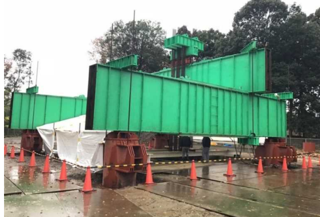
写真 1 構造性能を確認するための載荷試験状況