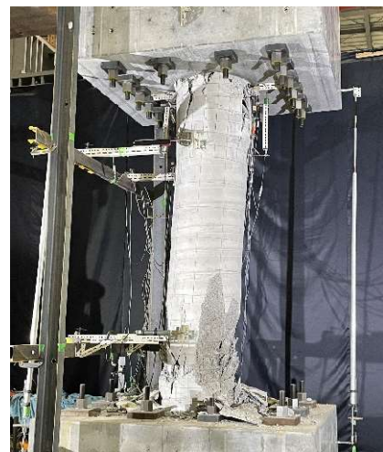
▲高強度鉄筋を用いた杭体の構造性能確認実験状況