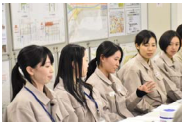
ダイバーシティワーキンググループの活動

「基礎固め期」は、入社から30歳頃までを考慮し、将来職務の幅を狭めることがないよう業務の基礎を身につける期間です。この中で、職種別に経験すべき職務や取得すべき資格を明確化し、指針としています。「ライフイベント期」では30歳から45歳までを想定し、育児等で時間や体力が制限される中、フォローを受けられる環境の中で職務経験を積む期間です。ただし、子供の成長や周囲のサポートなど状況に応じて、仕事の比重を大きくするなど柔軟に選択が出来る余地を残しています。「キャリア発揮期」は、ライフイベントが一段落し、これまで培ってきた知識や経験、能力を発揮し、組織の中核を担う人材として活躍してもらう期間です。