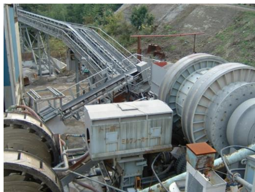
再生骨材の製造設備

BFCCU 研究会参加各社はサプライチェーン全体の CO 2 排出量削減ならびに資源の有効活用に取り組んでいます。今後は、環境配慮性の高いコンクリートである CELBIC-RA の実現場での普及・展開を図り、サーキュラーエコノミーの実現ならびに 2050 年カーボンニュートラルの実現に貢献してまいります。