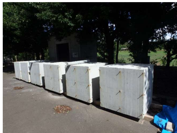
開発実験で作製した模擬部材試験体の様子